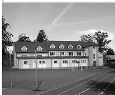
sokolovna - ubytovna