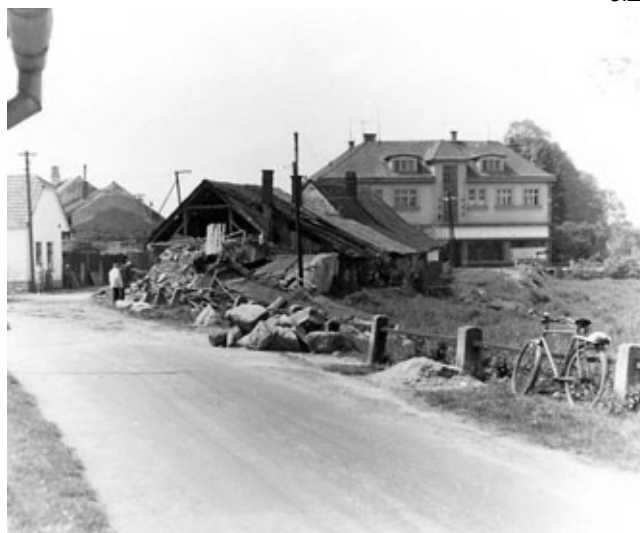
bourání domků 1968