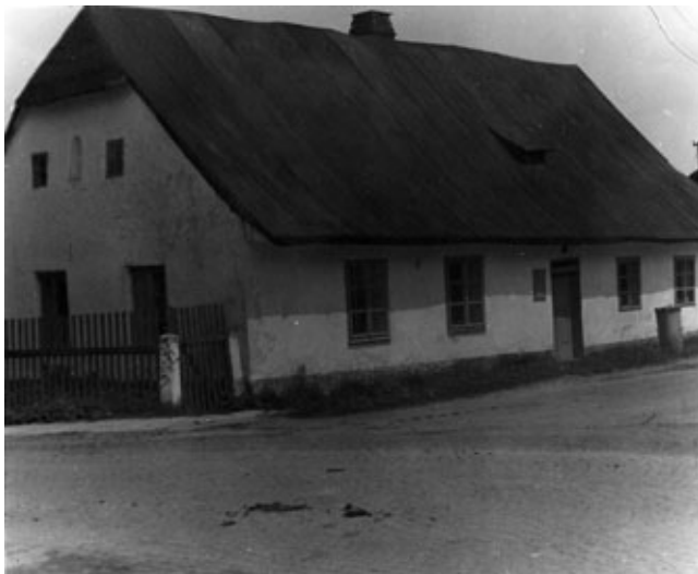
zde bydleli Tůmovi